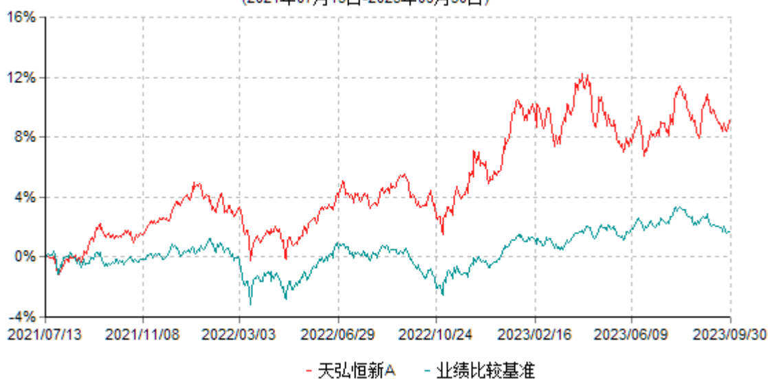
天弘恒新A累计净值增长率与业绩比较基准收益率历史走势对比图 (2021年07月13日-2023年09月30日)