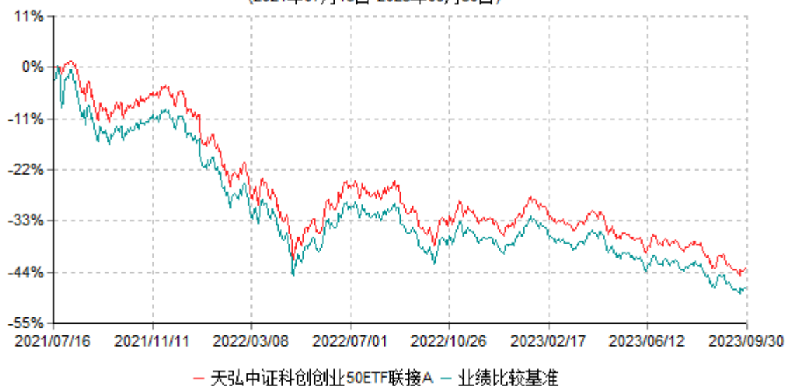
天弘中证科创创业50ETF联接A累计净值增长率与业绩比较基准收益率历史走势对比图 (2021年07月16日-2023年09月30日)