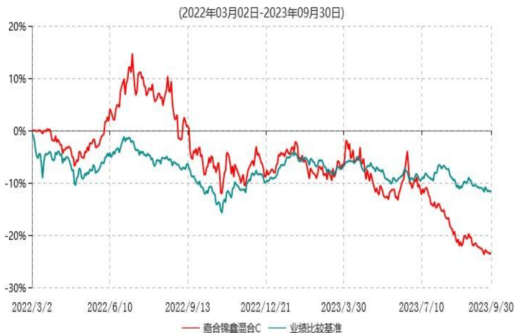
嘉合锦鑫混合C累计净值增长率与业绩比较基准收益率历史走势对比图