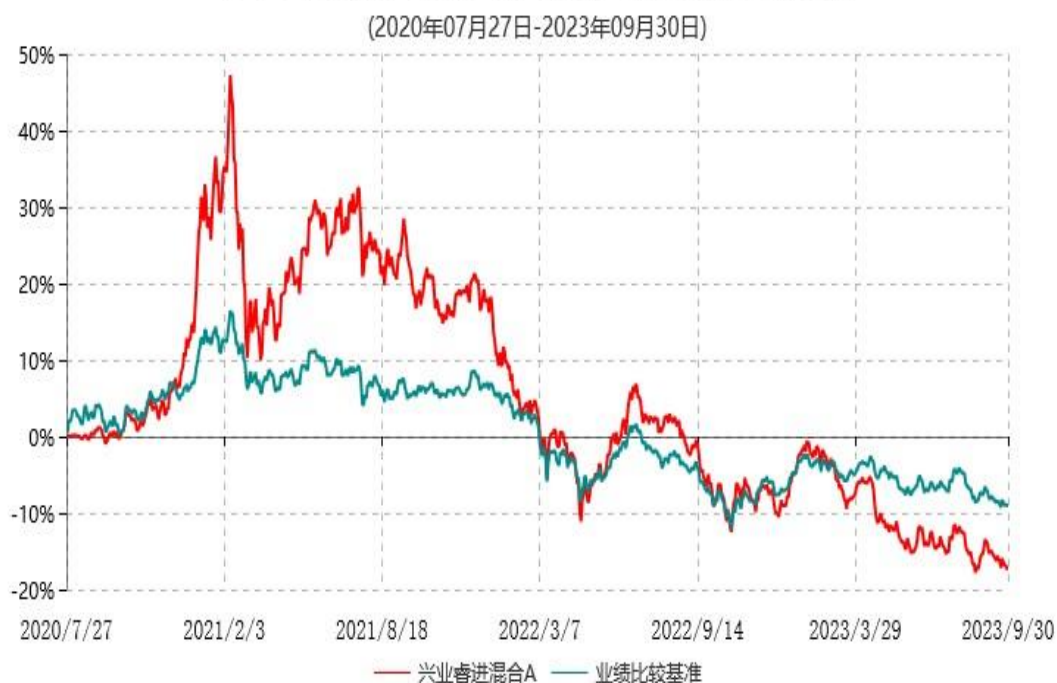
兴业睿进混合A累计净值增长率与业绩比较基准收益率历史走势对比图