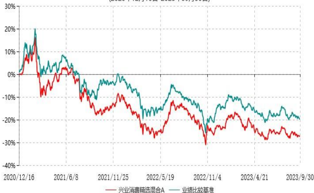
兴业消费精选混合A累计净值增长率与业绩比较基准收益率历史走势对比图 (2020年12月16日-2023年09月30日)