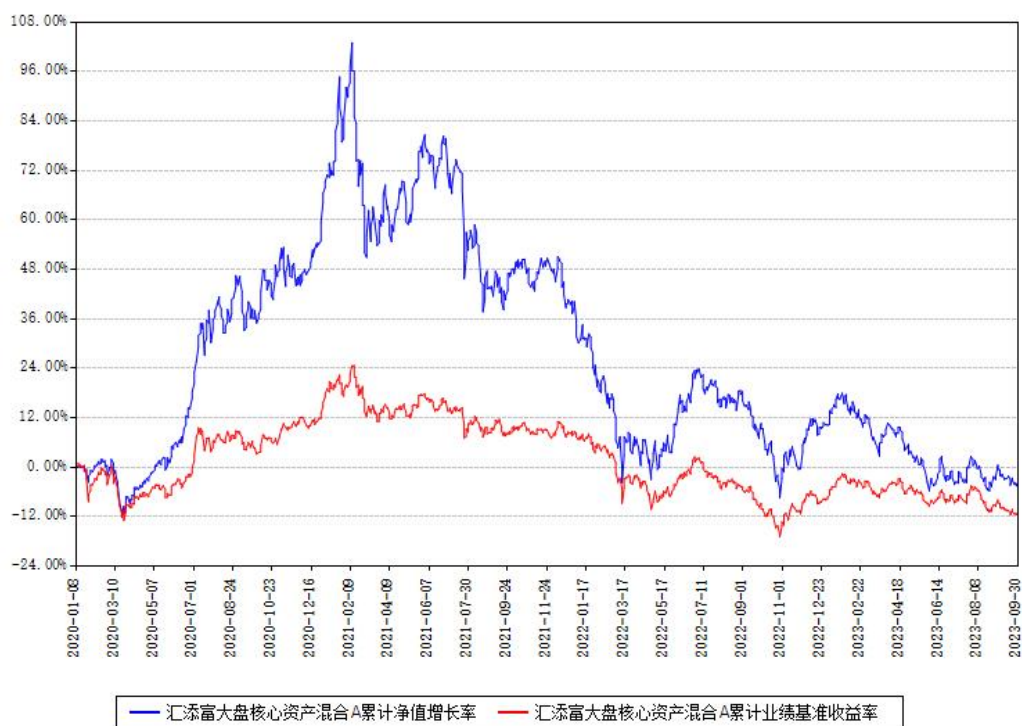
汇添富大盘核心资产混合A累计净值增长率与同期业绩比较基准收益率对比图