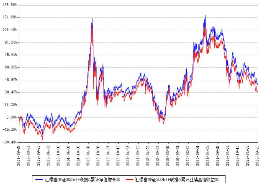
汇添富深证300ETF联接A累计净值增长率与同期业绩基准收益率对比图