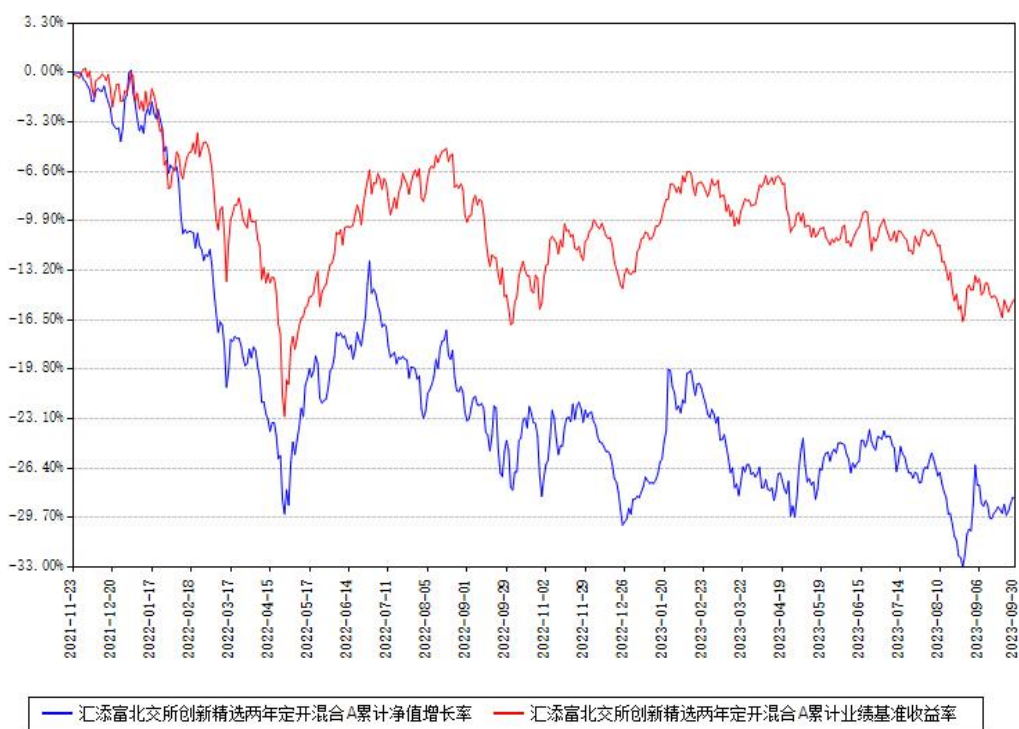
汇添富北交所创新精选两年定开混合A累计净值增长率与同期业绩比较基准收益率对比图