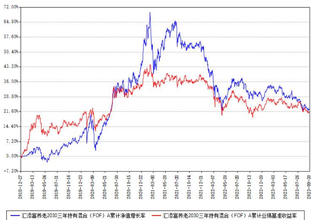
汇添富养老2030三年持有混合（FOF）A累计净值增长率与同期业绩比较基准收益率对比图