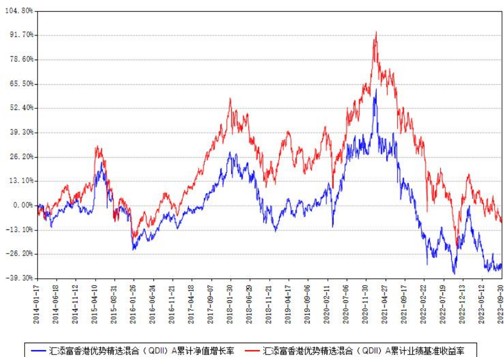
汇添富香港优势精选混合（QDII）A累计净值增长率与同期业绩基准收益率对比图