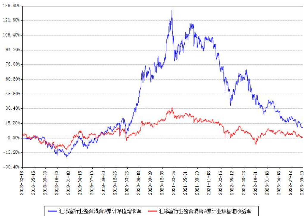
汇添富行业整合混合C累计净值增长率与同期业绩基准收益率对比图