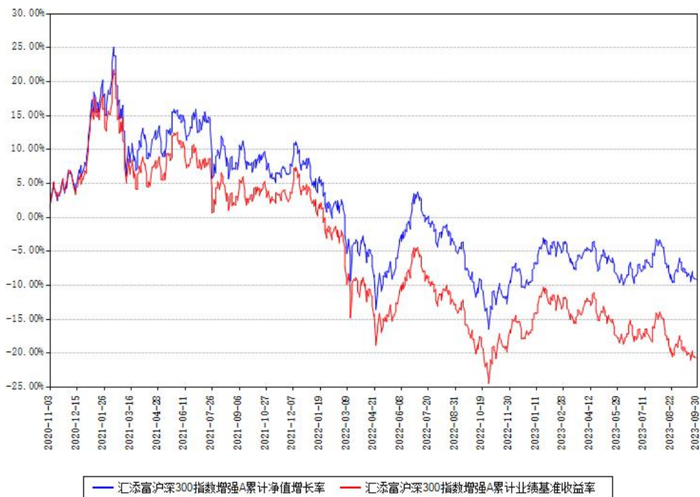
汇添富沪深300指数增强A累计净值增长率与同期业绩基准收益率对比图