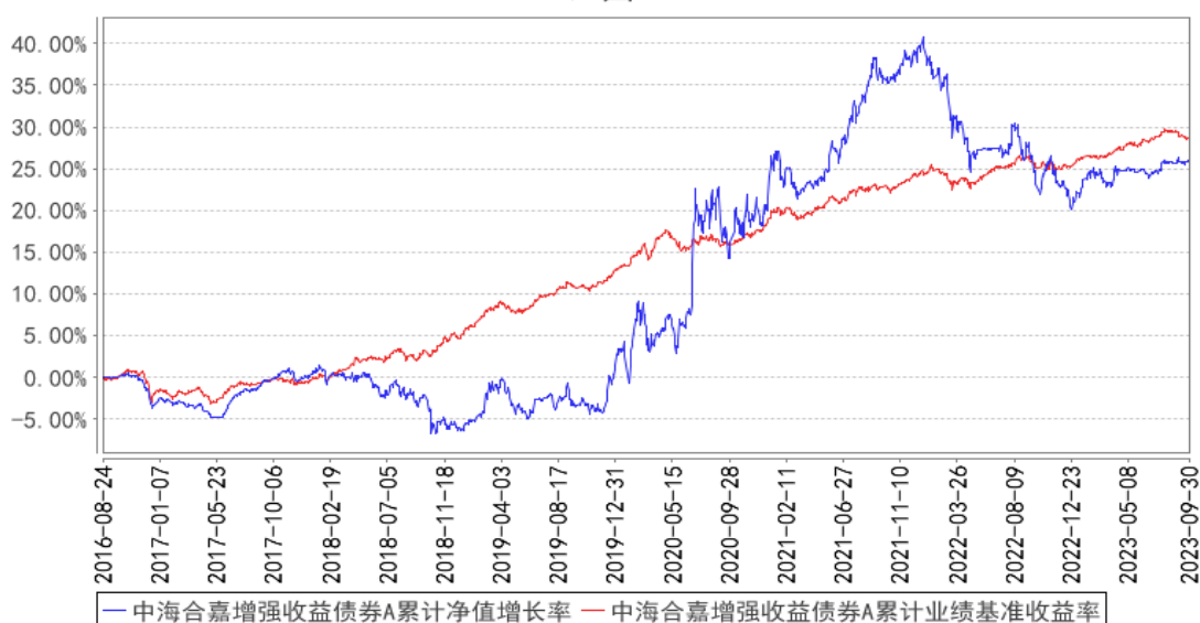
中海合嘉增强收益债券A累计净值增长率与同期业绩比较基准收益率的历史走势对比图