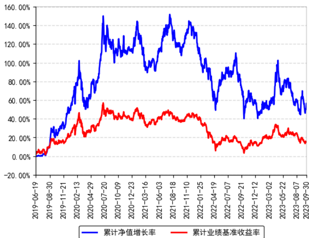
南方信息创新混合A累计净值增长率与同期业绩比较基准收益率的历史走势对比图