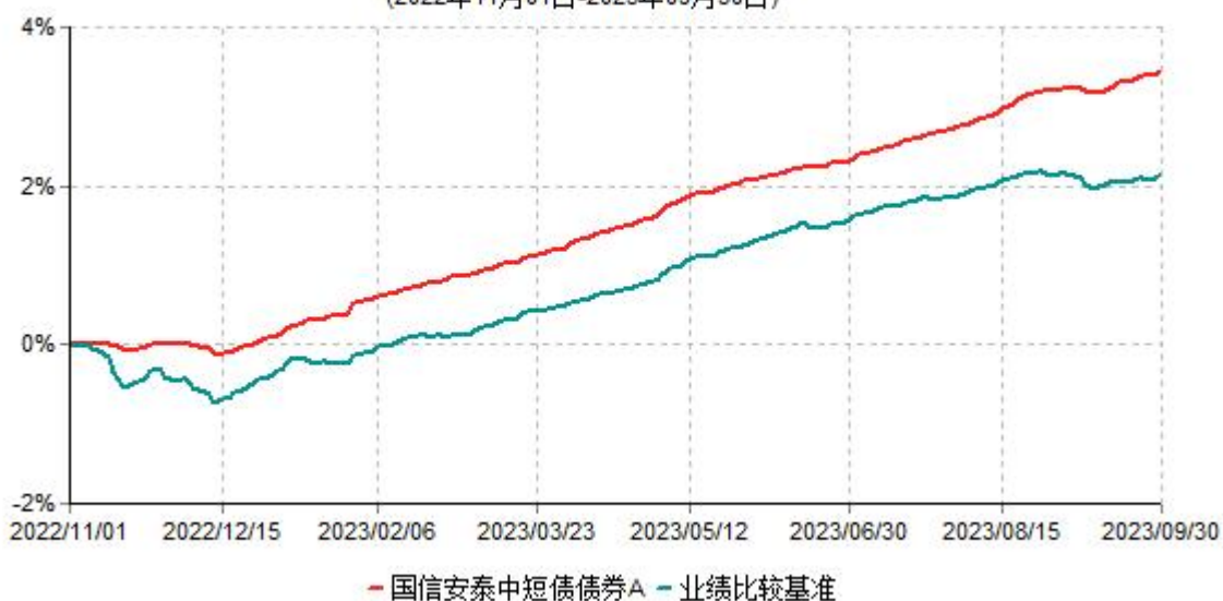
国信安泰中短债债券A累计净值增长率与业绩比较基准收益率历史走势对比图 (2022年11月01日-2023年09月30日)

注：1. 本集合计划合同于 2022 年 11 月 1 日生效，截至本报告期末本集合计划成立未满一年； 2. 按集合计划合同和招募说明书的约定，本集合计划建仓期为合同生效后 6 个月，报告期末已完成建仓，各项资产配置比例符合合同有关规定。