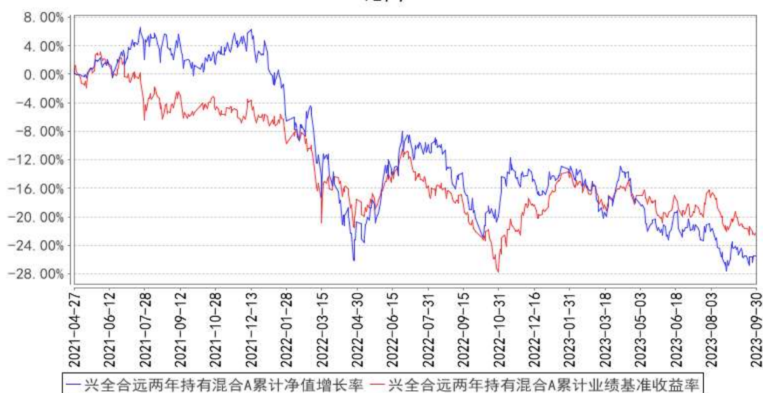
兴全合远两年持有混合A累计净值增长率与同期业绩比较基准收益率的历史走势对比图