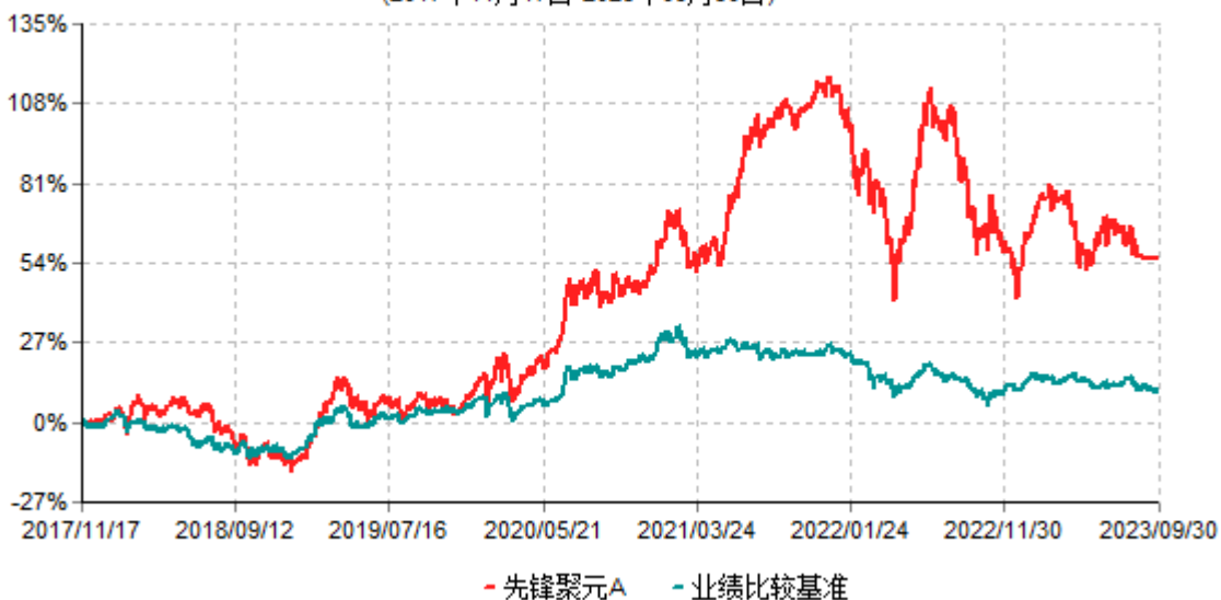
先锋聚元A累计净值增长率与业绩比较基准收益率历史走势对比图 (2017年11月17日-2023年09月30日)