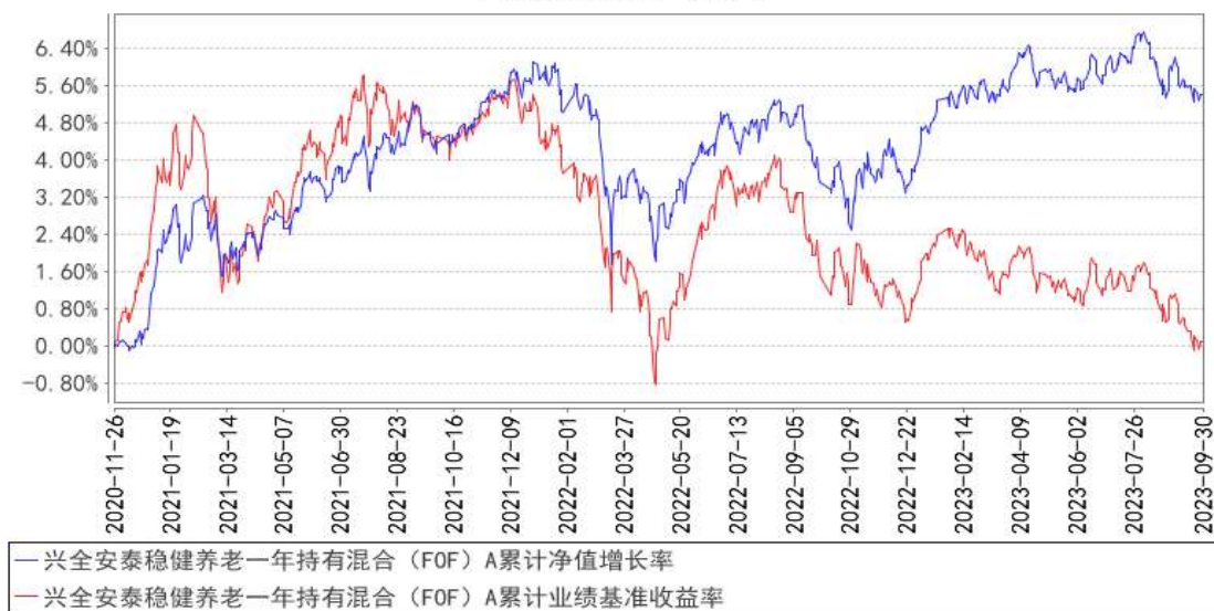
兴全安泰稳健养老一年持有混合（FOF）A 累计净值增长率与同期业绩比较基准收益率的历史走势对比图