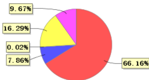
投资组合资产配置图表(2023年3月31日)

● 固定收益投资 ● 买入返售金融资产 ● 其他资产 ● 权益投资 ● 银行存款和结算备付金合计