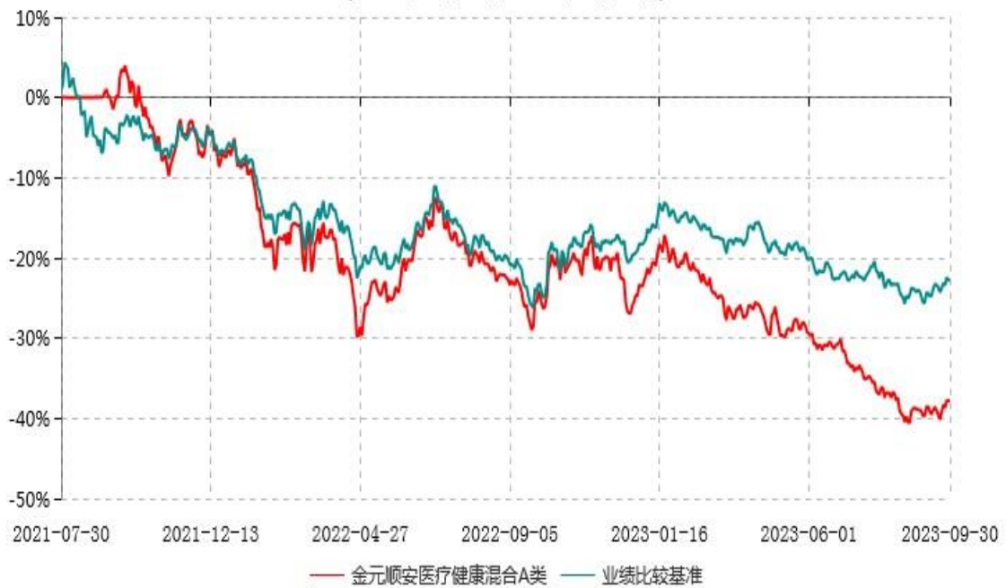
金元顺安医疗健康混合A类累计净值增长率与业绩比较基准收益率历史走势对比图 (2021年07月29日-2023年09月30日)