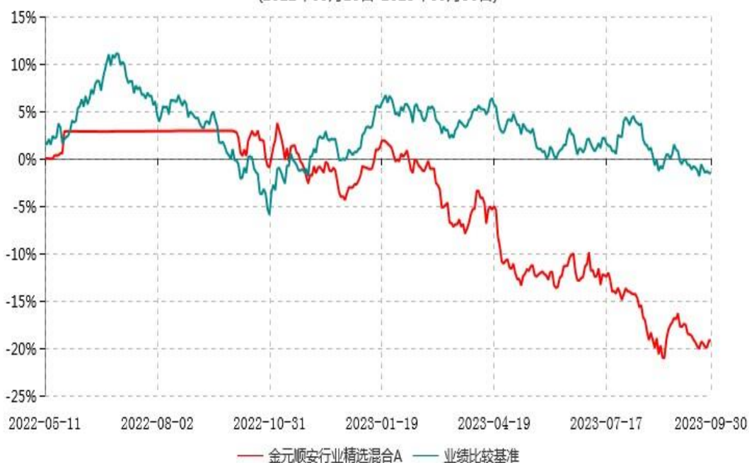
金元顺安行业精选混合A累计净值增长率与业绩比较基准收益率历史走势对比图 (2022年05月10日-2023年09月30日)