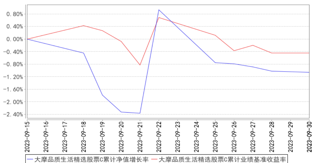
大摩品质生活精选股票C累计净值增长率与同期业绩比较基准收益率的历史走势对比图