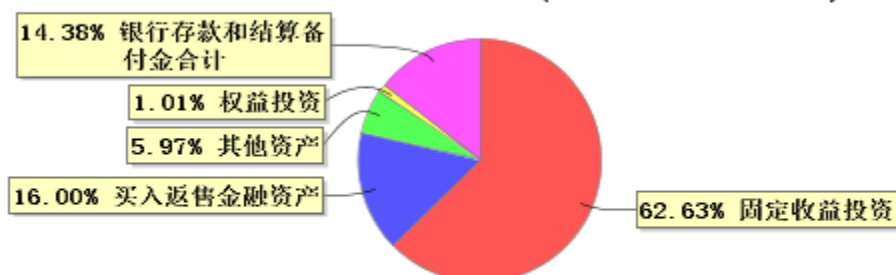
投资组合资产配置图表(2023年9月30日)

● 固定收益投资 ● 买入返售金融资产 ● 其他资产 ● 权益投资 ● 银行存款和结算备付金合计