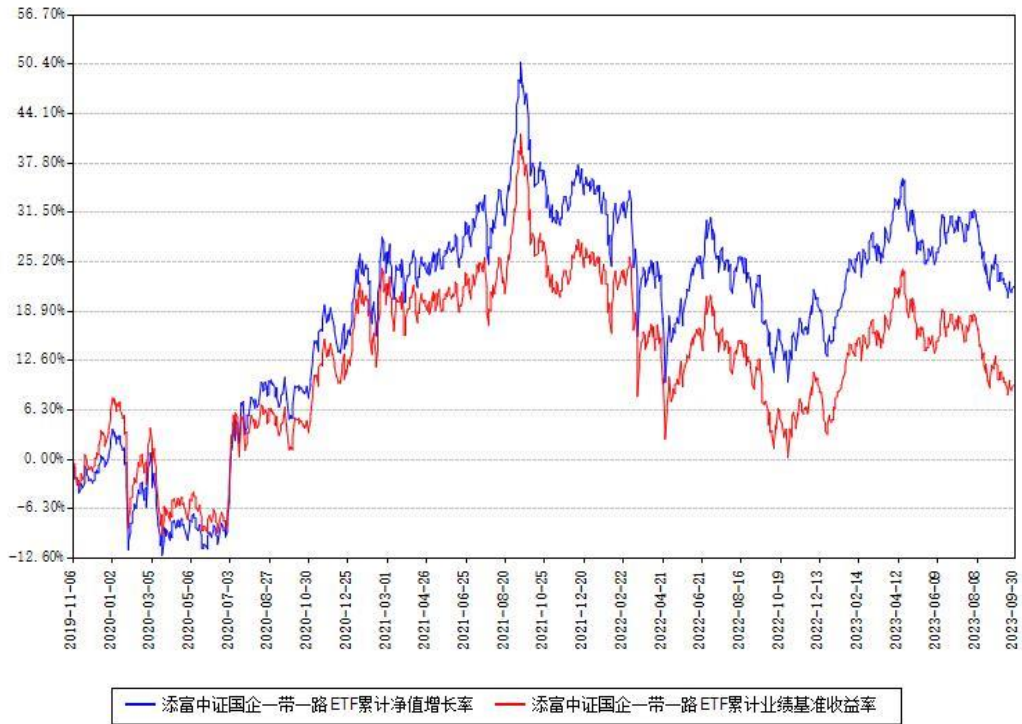
添富中证国企一带一路ETF累计净值增长率与同期业绩基准收益率对比图