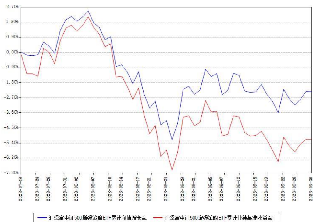
汇添富中证500增强策略ETF累计净值增长率与同期业绩基准收益率对比图

(二) 自基金合同生效以来基金累计净值增长率变动及其与同期业绩比较基准收益率变动的比较图