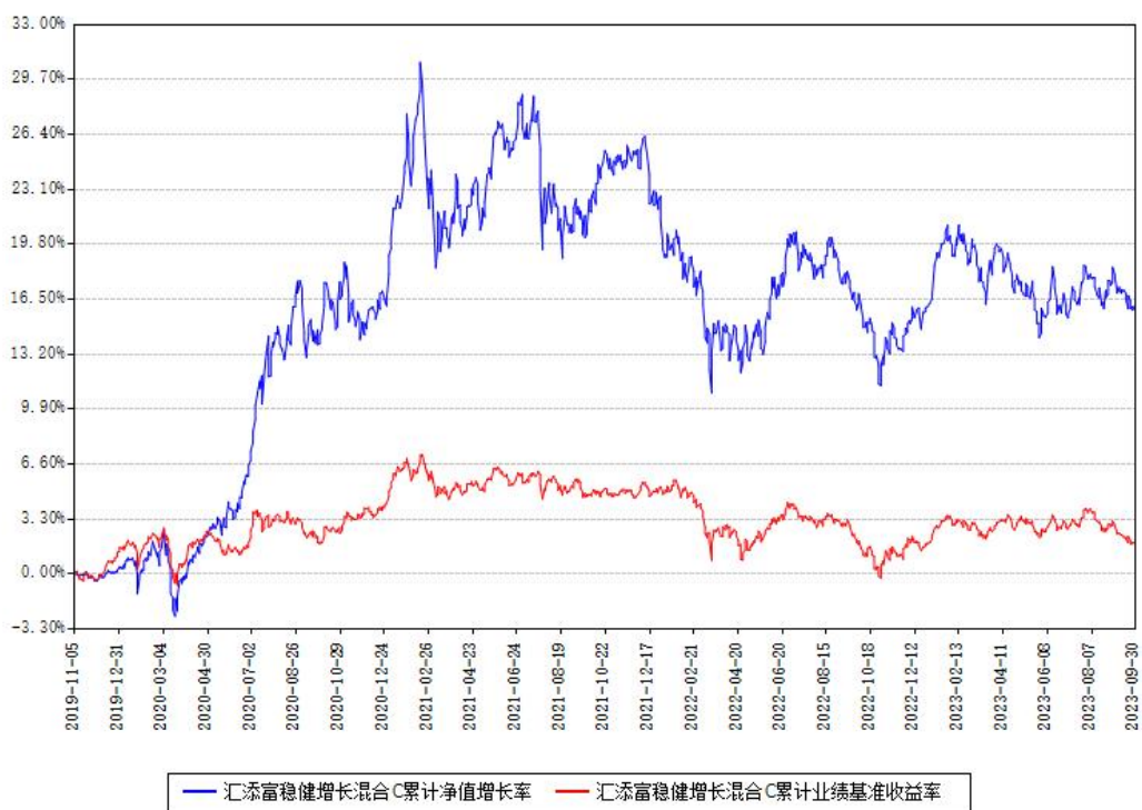
汇添富稳健增长混合C累计净值增长率与同期业绩基准收益率对比图