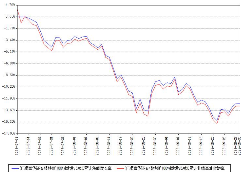
汇添富华证专精特新100指数发起式C累计净值增长率与同期业绩基准收益率对比图