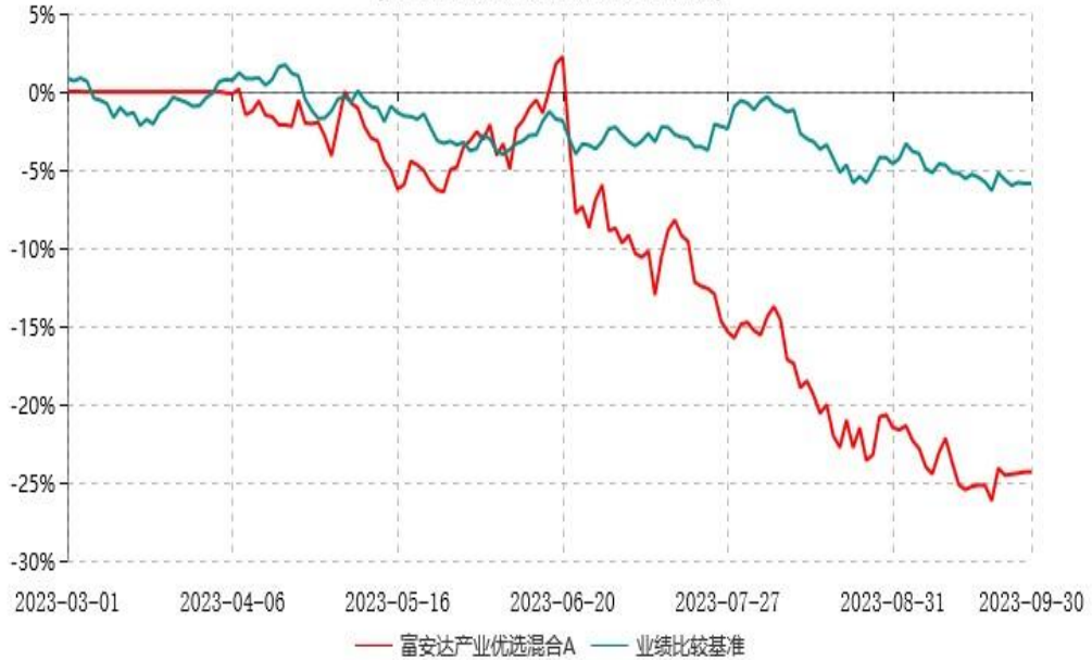
富安达产业优选混合C累计净值增长率与业绩比较基准收益率历史走势对比图