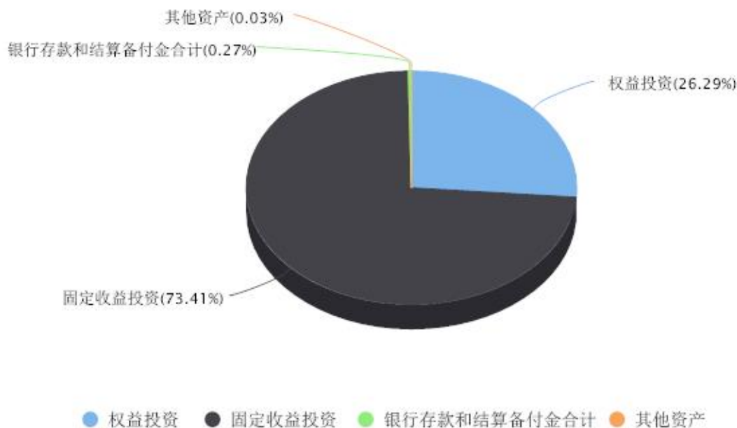
投资组合资产配置图表 数据截止日期:2022年12月31日