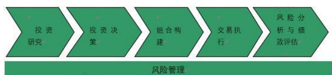
图 1 投资管理流程

本基金管理人建立了规范的投资管理流程和严格的风险管理体系，贯彻于投资研究、投资决策、组合构建、交易执行、风险管理及绩效评估的全过程。