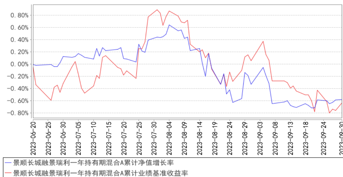
景顺长城融景瑞利一年持有期混合A累计净值增长率与同期业绩比较基准收益率的历史走势对比图