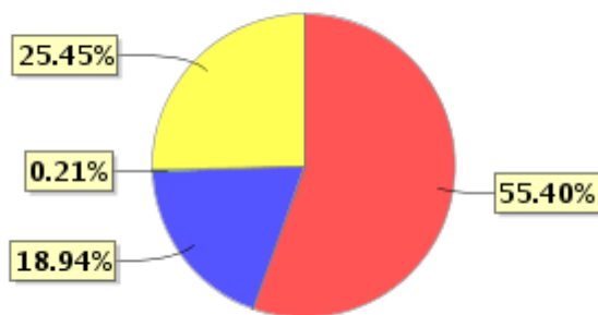
投资组合资产配置图表(2023年9月30日)

● 固定收益投资 ● 买入返售金融资产 ● 其他资产 ● 银行存款和结算备付金合计