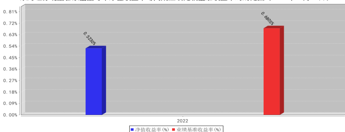
东海证券现金管家基金每年净值收益率与同期业绩比较基准收益率的对比图（2022年12月31日）