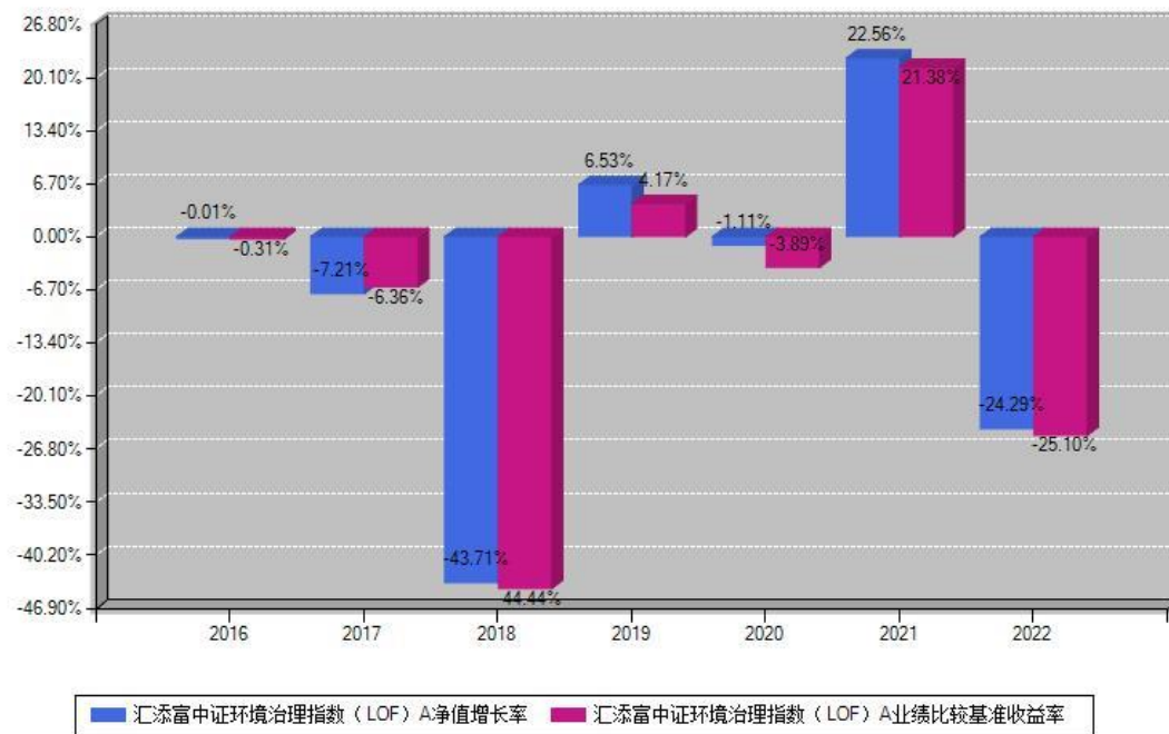
汇添富中证环境治理指数 (LOF) A 每年净值增长率与同期业绩基准收益率对比图

注：基金的过往业绩不代表未来表现。本《基金合同》生效之日为2016年12月29日，合同生效当年按实际存续期计算，不按整个自然年度进行折算。