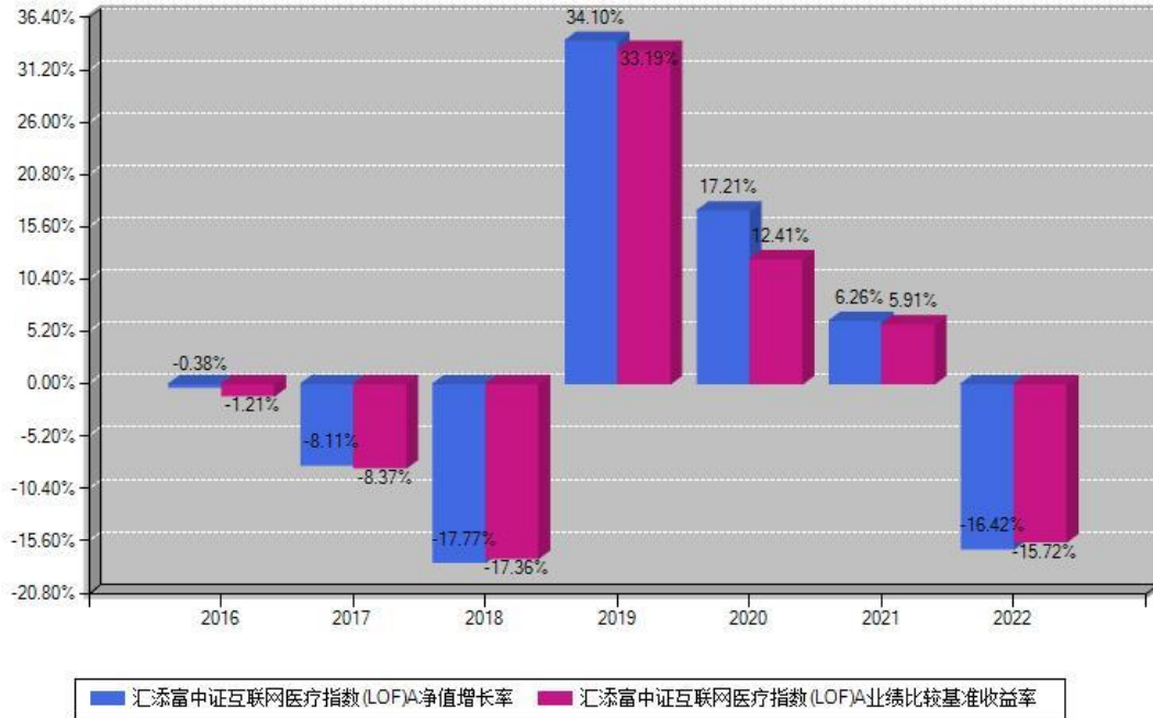
汇添富中证互联网医疗指数 (LOF)A 每年净值增长率与同期业绩基准收益率对比图

注：基金的过往业绩不代表未来表现。本《基金合同》生效之日为2016年12月22日，合同生效当年按实际存续期计算，不按整个自然年度进行折算。