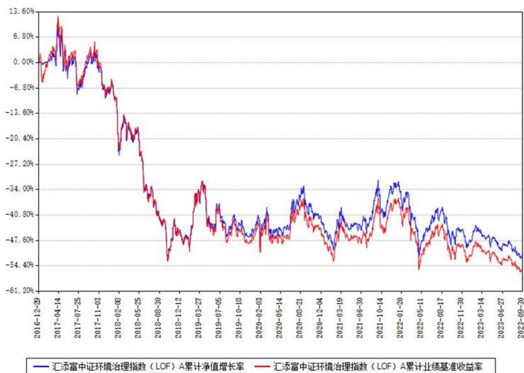
汇添富中证环境治理指数（LOF）A累计净值增长率与同期业绩基准收益率对比图