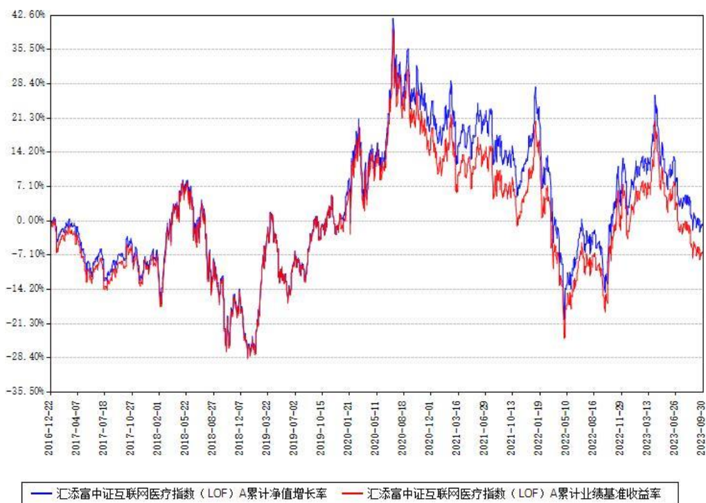
汇添富中证互联网医疗指数（LOF）A累计净值增长率与同期业绩基准收益率对比图

(二)自基金合同生效以来基金累计净值增长率变动及其与同期业绩比较基准收益率变动的比较图