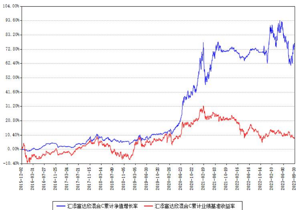
汇添富达欣混合C累计净值增长率与同期业绩基准收益率对比图