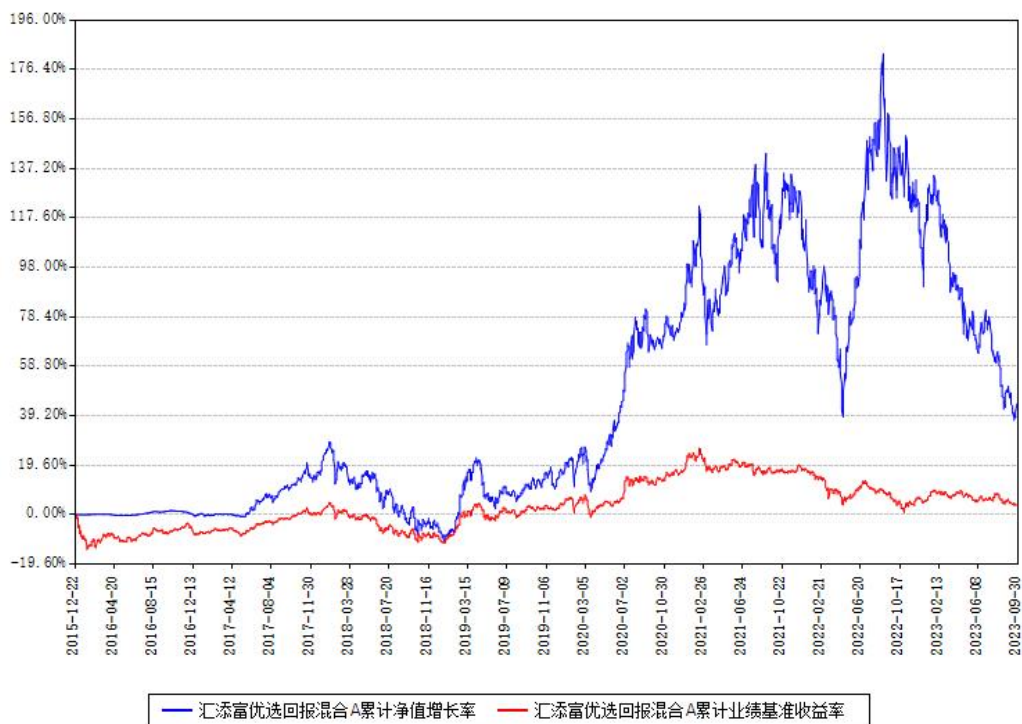
汇添富优选回报混合A累计净值增长率与同期业绩基准收益率对比图