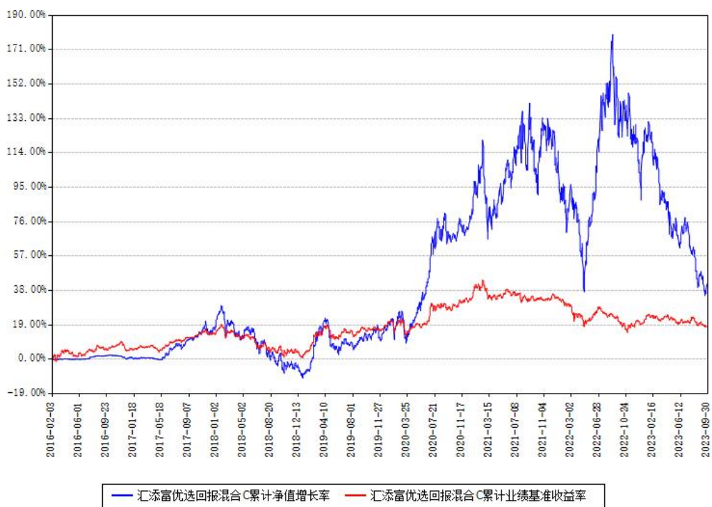
汇添富优选回报混合C累计净值增长率与同期业绩基准收益率对比图