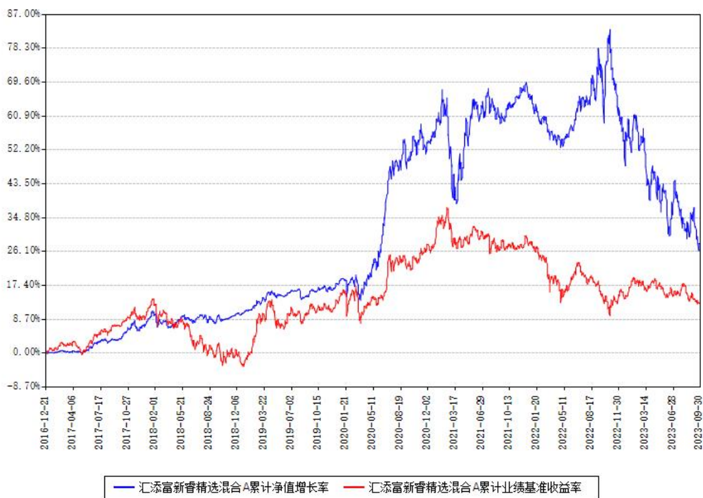
汇添富新睿精选混合A累计净值增长率与同期业绩基准收益率对比图

(二) 自基金合同生效以来基金累计净值增长率变动及其与同期业绩比较基准收益率变动的比较图