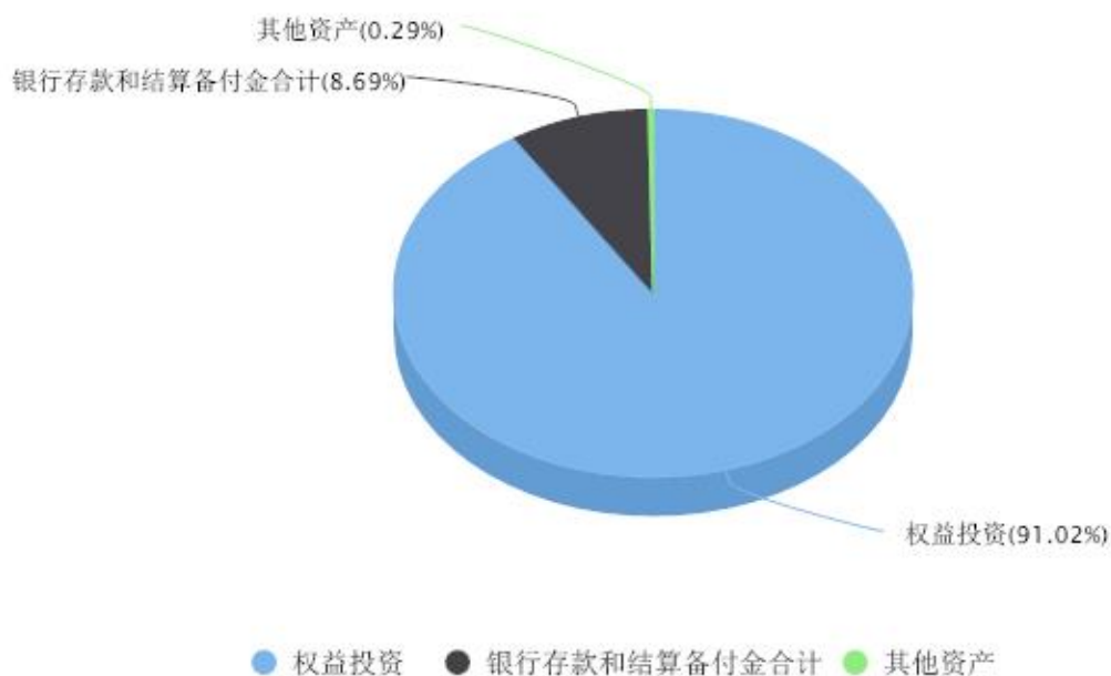
投资组合资产配置图表 数据截止日期:2023年09月30日