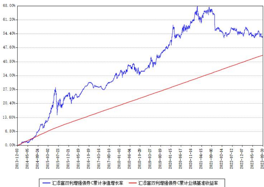
汇添富双利增强债券C累计净值增长率与同期业绩基准收益率对比图