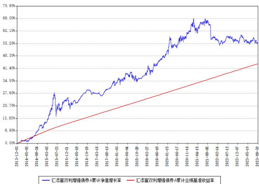
汇添富双利增强债券A累计净值增长率与同期业绩基准收益率对比图