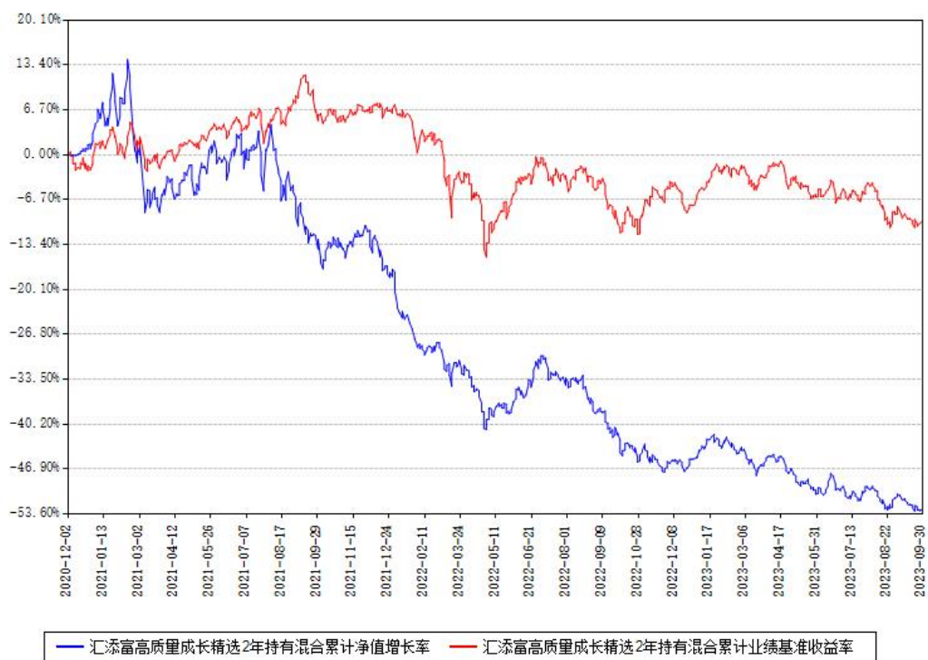
汇添富高质量成长精选2年持有混合累计净值增长率与同期业绩基准收益率对比图