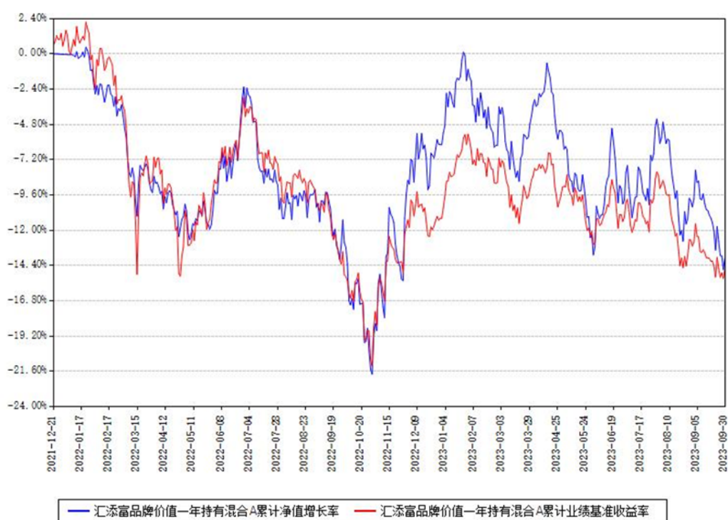
汇添富品牌价值一年持有混合A累计净值增长率与同期业绩基准收益率对比图