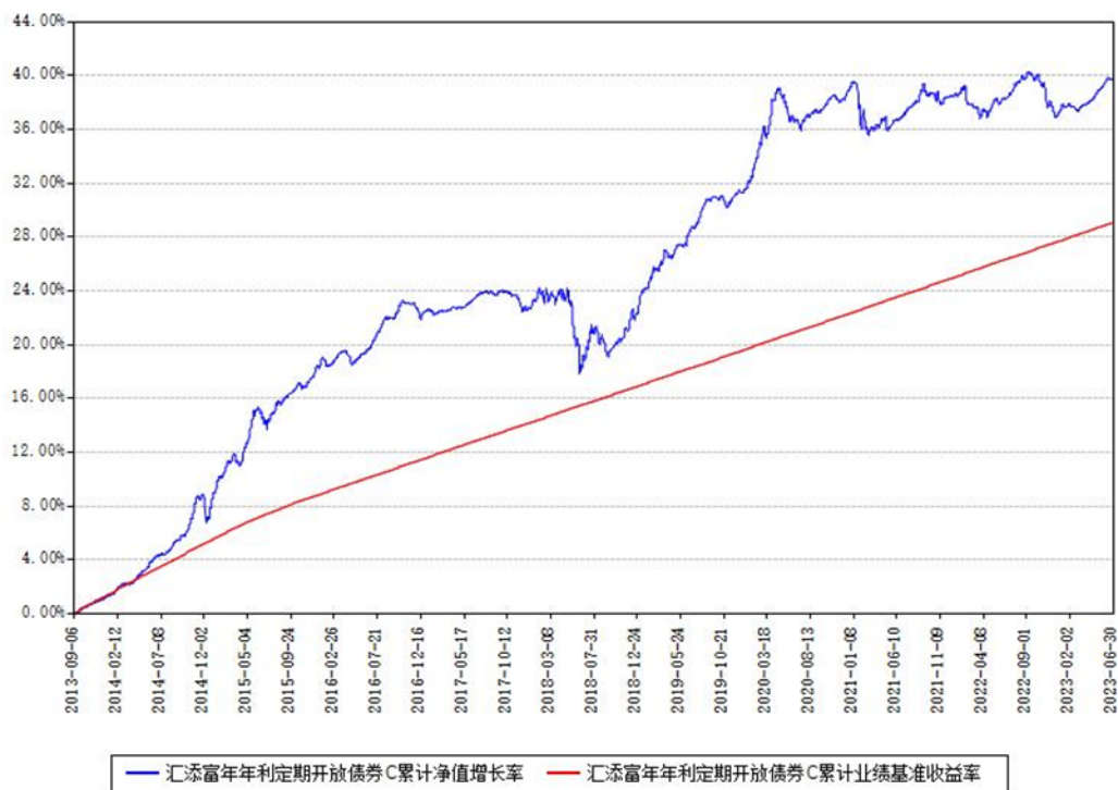
汇添富年年利定期开放债券C累计净值增长率与同期业绩基准收益率对比图