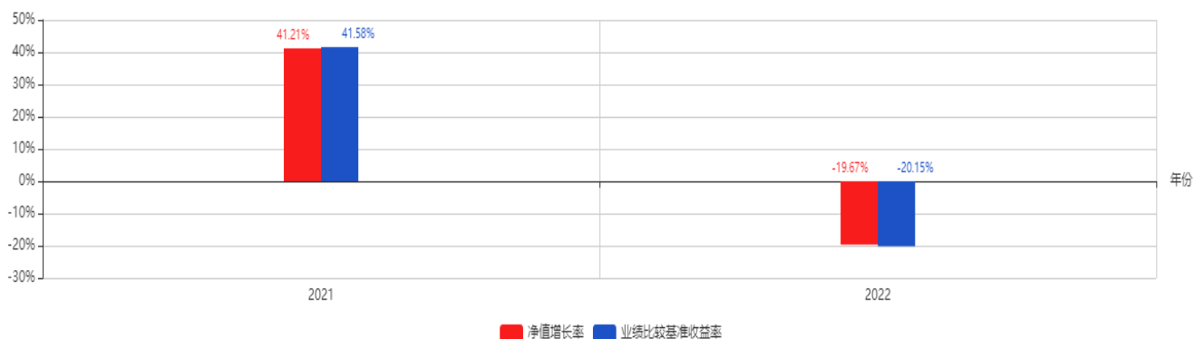
基金每年的净值增长率及与同期业绩比较基准的比较图

注：业绩表现截止日期 2022 年 12 月 31 日。基金过往业绩不代表未来表现。