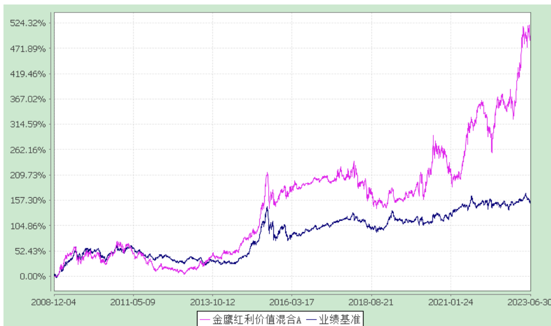
金鹰红利价值混合C: