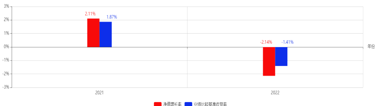
基金每年的净值增长率及与同期业绩比较基准的比较图