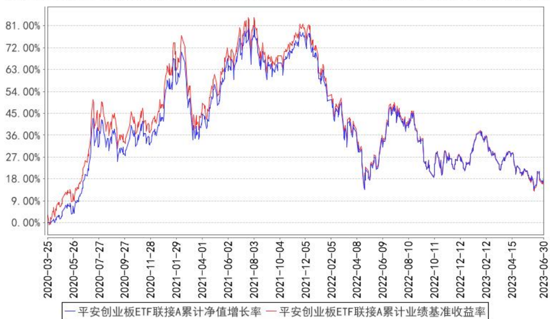
平安创业板ETF联接A累计净值增长率与同期业绩比较基准收益率的历史走势对比图