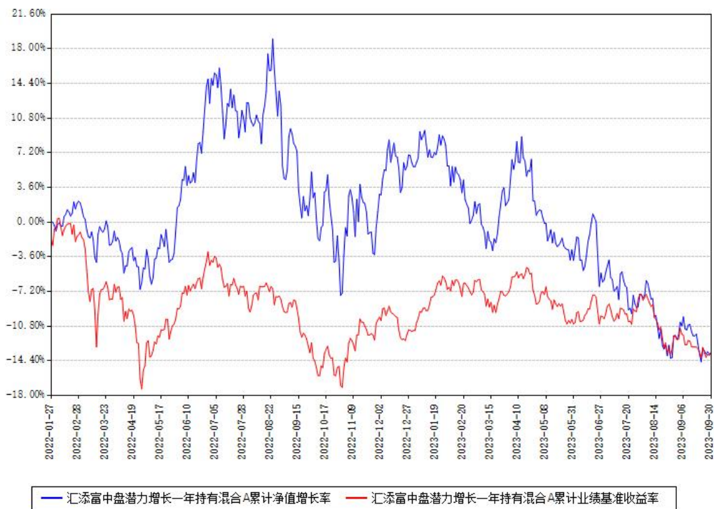
汇添富中盘潜力增长一年持有混合A累计净值增长率与同期业绩基准收益率对比图